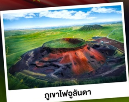
ภูเขาไฟอูลันดา

ท่องเที่ยวแดนแห่งทะเลทรายและทุ่งหญ้า ชมพระอาทิตย์ขึ้นทุ่งหญ้าออร์ดอส