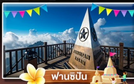
ฟานชิปัน