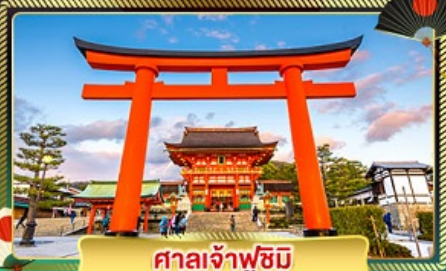
ศาลเจ้าฟูชิมิ