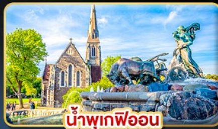
น้ำพุเกฟออน