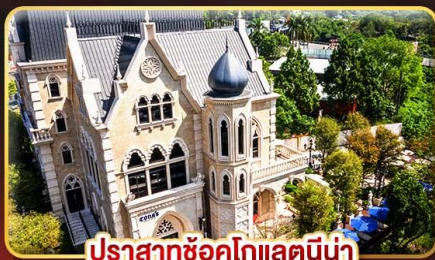
ปราสาทซอกโกแลตนี้่น่า

มรดกแห่งเมืองสี่พันแควไทเป ช้อปปิ้งใจ..ตลาดซีเหมินติง ตลาดโจง