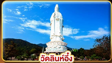
วัดลินห์อึ้ง