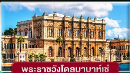
พระราชวังโดลมาบาห์เซ่