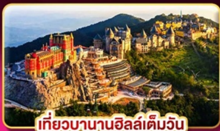
เที่ยวบานาฮิลล์เต็มวัน

ล่องกระทงขามดำคืนที่ฮอยอัน ไฟล์ทสวย บินเช้า-กลับเย็น