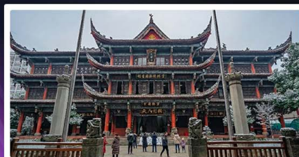
วัดเหวินซู