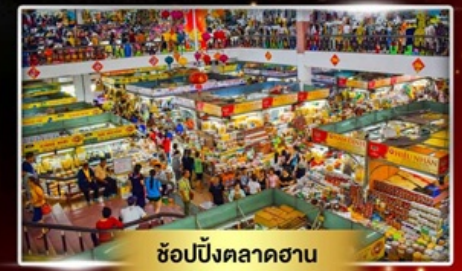
ช้อปปิ้งตลาดฮาน