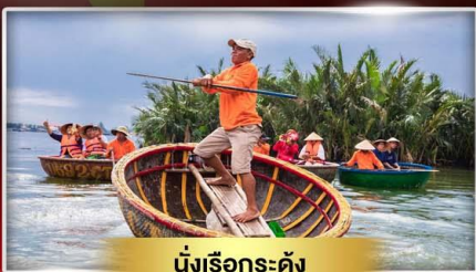
นั่งเรือกระดง