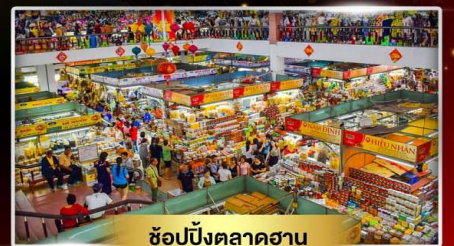
ช้อปปิ้งตลาดฮาน