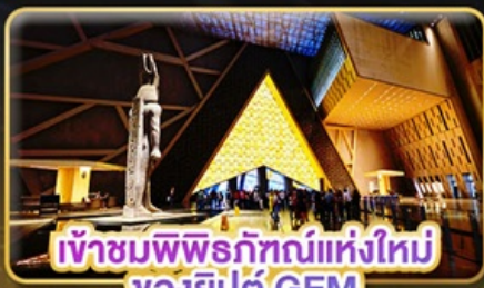
เข้าชมพิพิธภัณฑ์แห่งใหม่ ของอียิปต์ GEM