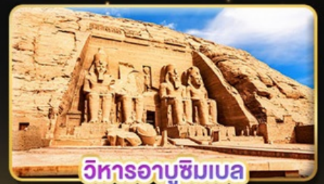
วิหารอาบูซิมเบล

น้ำหนักกระเป๋า 23Kg. (บินระหว่างประเทศ และบินภายใน)