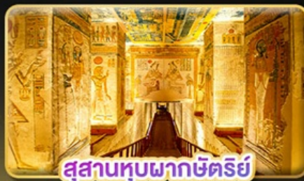
สุสานหุบผากษัตริย์