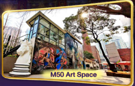
M50 Art Space