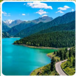
อุทยานเทียนชาน เทียนสู่อือ