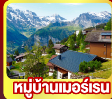
หมู่บ้านมอร์เรน

พิเศษ!! พิซิด 4 เหว ยอดเทวาร์กี , ยอดเขาจุงเฟรา ยอดเขารอนเนอร์เกรตและยอดเขาเอกทิสฮอร์น