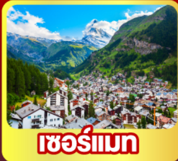
เชอร์แมนท์