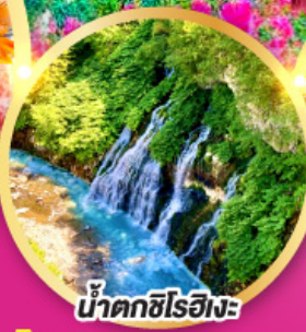
น้ำตกชิโรอิเงะ