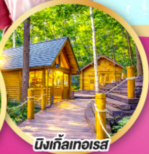
มิงกัลเกอเรส