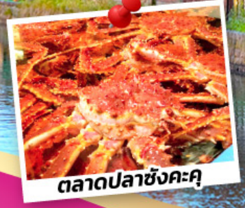
ตลาดปลาซังคะคุ

พักโอตารุ 1 คืน สัมผัสน้ำพุร้อนแสนโรแมนติก พักชิปปุโร 2 คืน ช้อปปิ้งจุใจ