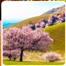
ทุ่งดอกอัลมอนด์