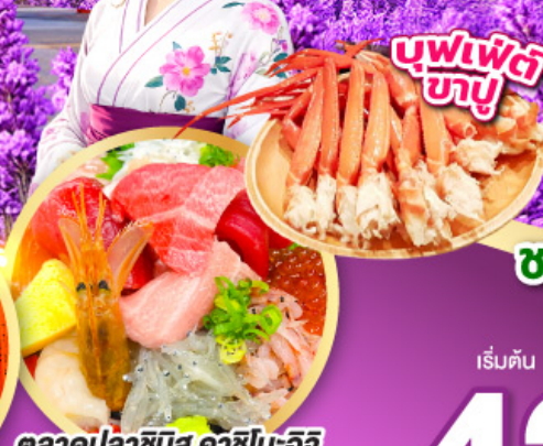
ตลาดปลาซิมิสุ คาชิโนะอิจิ