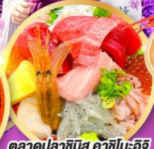
ตลาดปลาฮิมสุ คาชิโนะอิจิ