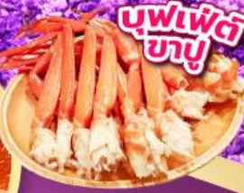
บุฟเฟ่ต์ ขาปู