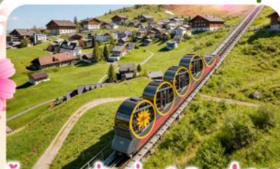
ชั้นรางที่ชันที่สุดในโลกสู่สตูล