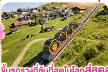
ขัั้นรรางที่ชันที่สุดในโลกสู่สตูล

พิชิตยอดเขาชุนเนกกา 1 ในเขาที่สวยงามที่สุดเมืองเซอร์แมท