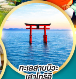
ทะเลสาบบิวะ เสาโทริอิ

เส้นทางสายอัลไพน์ทากายามา กำแพงหิมะ เพื่อนคู่โรเบะ