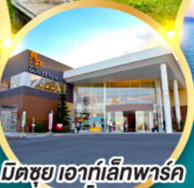
มิตรชยุ เอากีลีกพาร์ค คาโดมะ