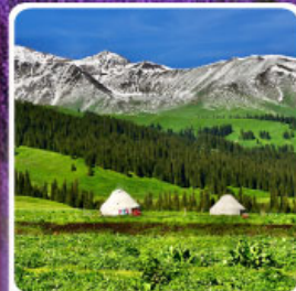
ทุ่งหญ้านาลาติ