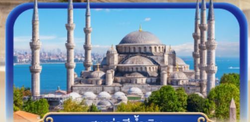
สุเหร่าสีน้ำเงิน