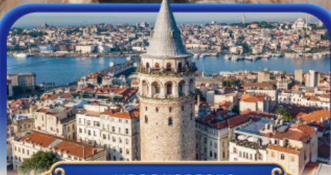
หอคอยกาลาตา