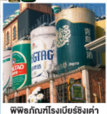
พิพิธภัณฑ์โรงเบียร์ชิงเต่า