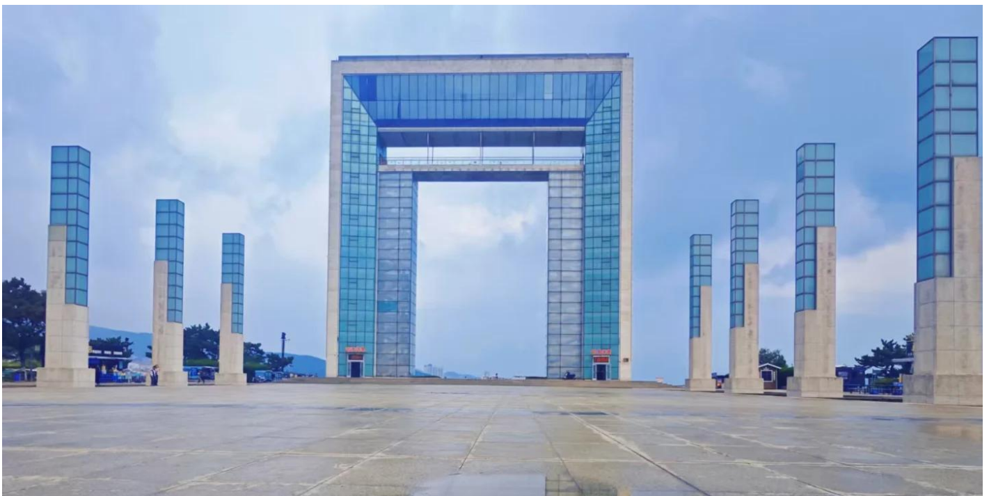
บ่าย ไปกันต่อที่ ประตูแห่งโชคกลาง สัญลักษณ์แห่งเว่ยไห่ ประตูสู่ความปรารถนา ณ ริมหาดฝั่งทะเลเหลืองที่งดงามของเมืองเว่ยไห่ ที่ตั้งของสถาปัตยกรรมอันโดดเด่นตั้งตระหง่านอยู่ นั่นคือ “ประตูแห่งความสุข” หรือ “ประตูแห่งโชคกลาง” แลนด์มาร์คที่เป็นสัญลักษณ์แห่งความหวัง ความเจริญรุ่งเรือง และความสุขของชาวเมืองเว่ยไห่ ประตูแห่งนี้ถูกสร้างขึ้นเพื่อเฉลิมฉลองครบรอบ 100 ปีของการเปิดท่าเรือเว่ยไห่ และได้รับ