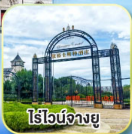
ไร่ไวน์จางยู