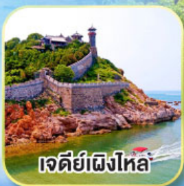
เจดีย์เฝิงไหล