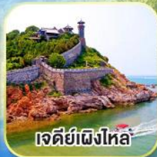
เจดีย์เฝิงไหล