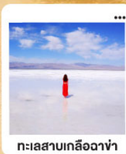
ทะเลสาบเกลือฉางซ่า