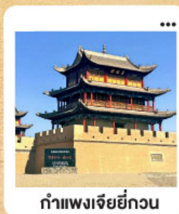
ถ้าแพงเจียยี่กวน