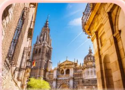
มหาวิหารแห่งโกเอลโด