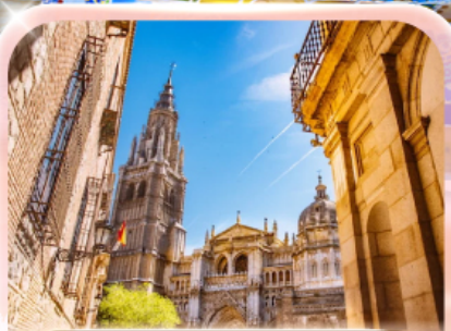
มหาวิหารแห่งโกเลโด