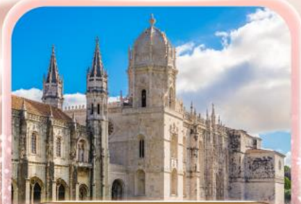
มหาวิหารเจอโรนีโม