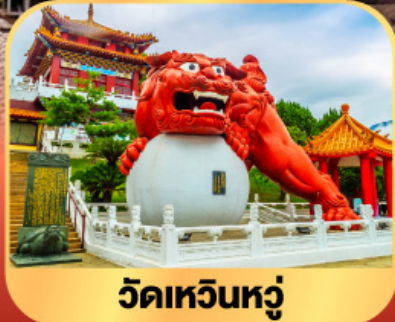
วัดเหวินหลู่