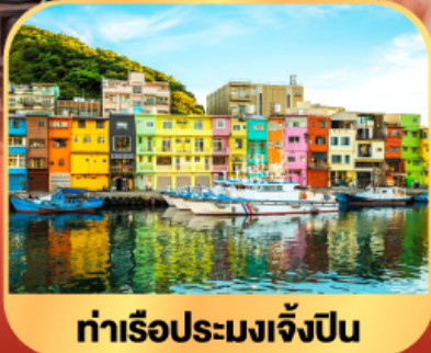
ท่าเรือประมงเจียงปิง