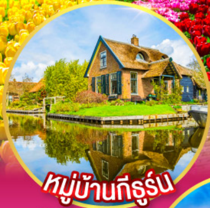
หมู่บ้านที่รูรัน