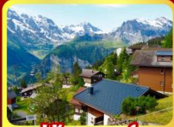
หมู่บ้านเมอร์เสน