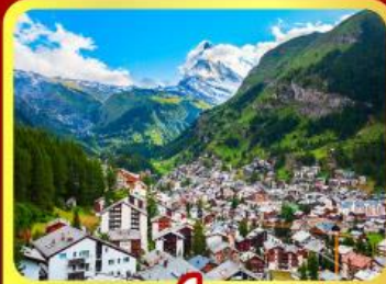
เชอร์แมท