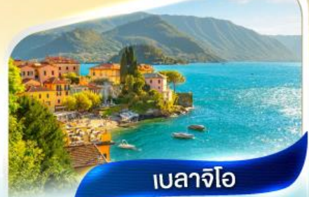
เบลาจีโอ