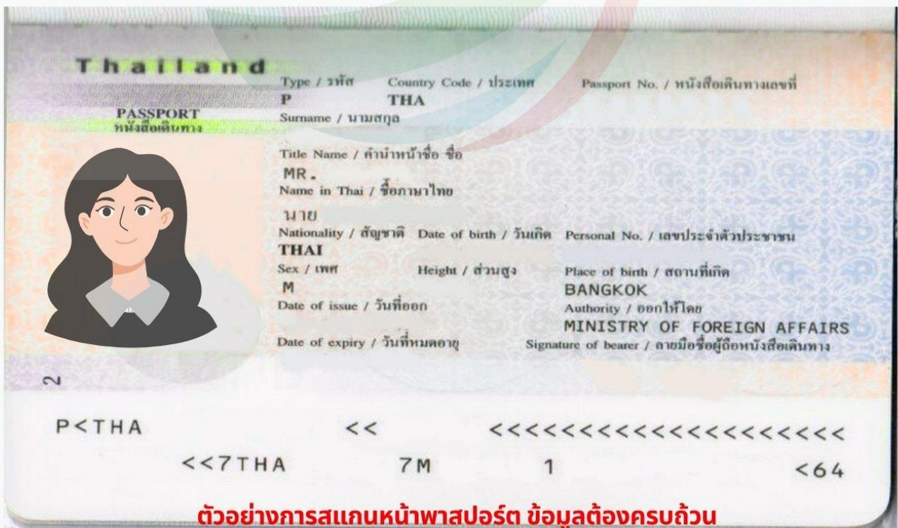
ตัวอย่างการสแกนหน้าพาสปอร์ต ข้อมูลต้องครบถ้วน ท่านสามารถสแกนส่งไฟล์ PDF หรือถ่ายรูปส่งแทนได้ ( รูปไม่เอียง ไม่ติดนิ้ว )

การพิจารณาวีซ่าเป็นดุลยพินิจของทางสถานทูตเท่านั้น ทางบริษัทเป็นผู้ดำเนินการเรื่องเอกสารและ อำนวยความสะดวก ซึ่งสามารถกรอกออนไลน์ได้ก่อนเดินทาง 30 วัน หรือหลังจากท่านชำระเงินงวด สุดท้าย ทั้งนี้หลังจากกรอกข้อมูลเข้าระบบแล้วใช้เวลาพิจารณา 7-15 วันทำการ กรณีวีซ่าท่านล่าช้า หรือถูกปฏิเสธและมีค่าใช้จ่ายเพิ่มเติม ทางบริษัทขอสงวนสิทธิ์เก็บตามค่าใช้จ่ายที่เกิดขึ้นจริง