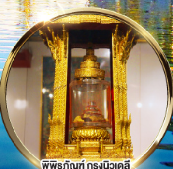
พิพิธภัณฑ์ กรุงนิวเดลี กราบนมัสการพระบรมสารีริกธาตุ