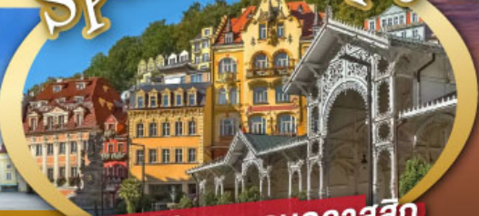
ชมสถาปัตยกรรมคลาสสิก เมือง คาร์โลวี วารี