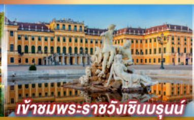
เข้าชมพระราชวังฮินบรุนน์