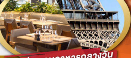
รับประทานอาหารกลางวัน บนหอไอเฟล

ไฮไลท์ในโปรแกรม • ถ่ายรูปคู่มือไอเฟลและพิพิธภัณฑลุ่มฟท์ • สะพานไม้ชาเปล ลูเซิร์น • ขึ้นกระเช้าสู่ยอดเขาจุงเฟรา • เมืองมรดกโลก กรุงเบิร์น • ถ่ายรูปปราสาทซิลยองที่มองเทรอซ์ • ศาลาไทย เมืองโลซานน์ • เดินเพลินๆ ณ เมืองเวเวย์