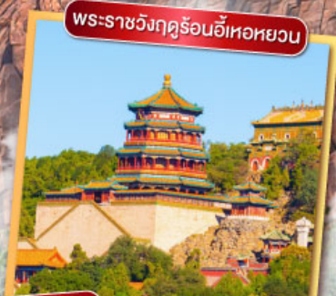
พระราชวังฤดูร้อนอื้อเหอหยวน