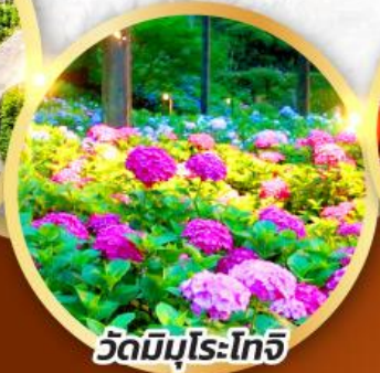
วัดมิมุโระโทจิ