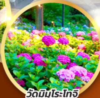
วัดมิมุโระโทจิ