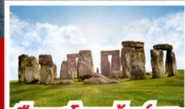
เยือนสโตนเฮ็นจ์ และ พิพิธภัณฑน์โรมันบาร