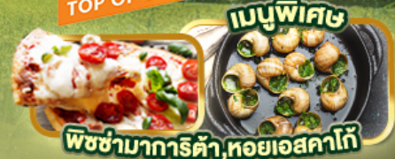
เมนูพิเศษ พิซซ่ามาริตต้า, ทอยเอสคาโก้