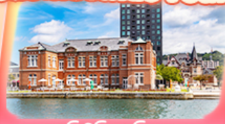
โมจิโกะ เรียวกัน

✈️ สายการบิน Vietjet Air (VZ) น้ำหนักกระเป๋า 20 KG