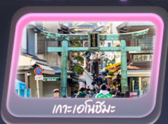
เกาะเอนอชิมะ