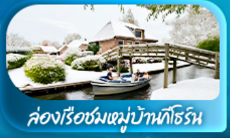
คลองเรือชมหมู่บ้านทอร์น

พิเศษ ล่องเรือแม่น้ำเซน ชมเมือง โดย บาโต มูช