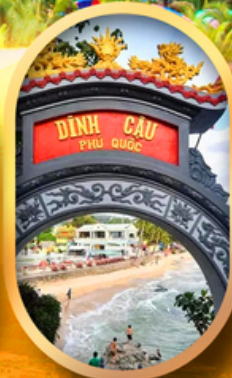
ศาลเจ้าติงเกา