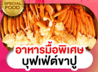
อาหารมือพิเศษ บุฟเฟ่ต์งาปู