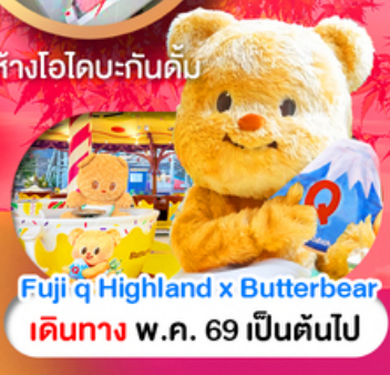
Fuji q Highland x Butterbear เดินทาง พ.ศ. 69 เป็นต้นไป