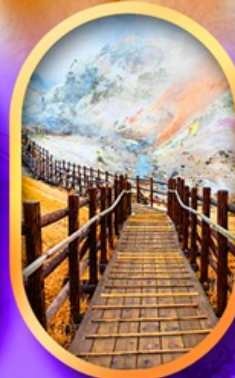
จิโกคุดานิ