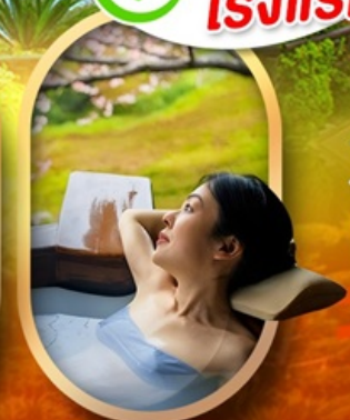
แช่ออนเซ็นญี่ปุ่น