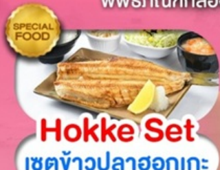
Hokke Set เซตข้าวปลาชอกเกะ