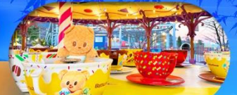
Fuji q Highland x Butterbear เดินทาง พ.ศ. 69 เป็นต้นไป