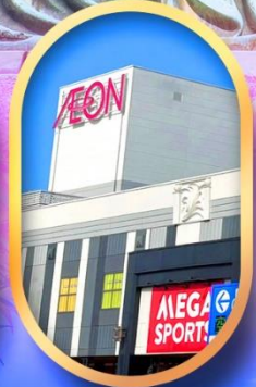
อีออนมอลล์