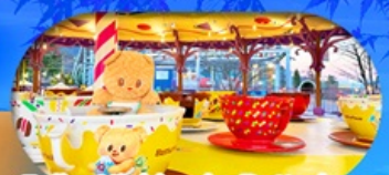
Fuji q Highland x Butterbear เดินทาง พ.ค. 69 เป็นต้นไป