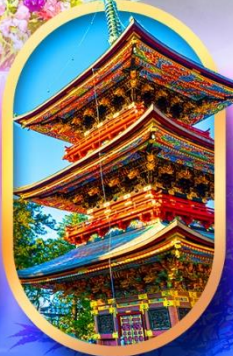
วัดนาริตะ-จิน