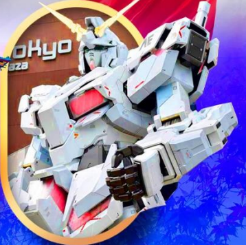
ห้างไอโดปะกับดัม