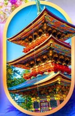
วัดนาริตะซัน