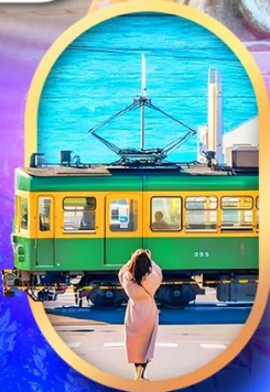
ถนนโคมาจิโดริ