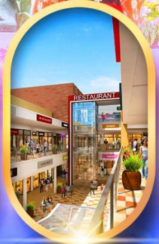
มิตซุยเอจิกิเอ็ต