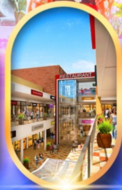
มิตซุยาอิก้าเกิ้ลิต