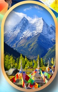
อุทยานสี่ครุณี