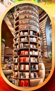
อุทยานปี้เฉิงโกว