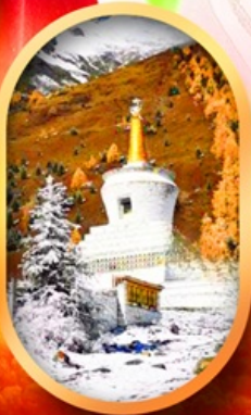
อุทยานสี่ตุ๋น