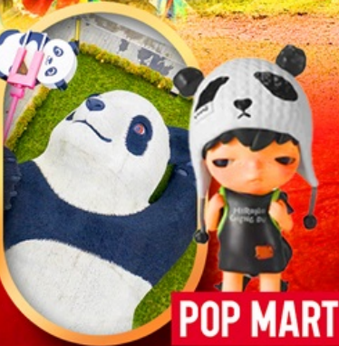
หมีแพนด้าเซลฟี