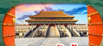
พระราชวังกู้กง Forbidden City Beijing