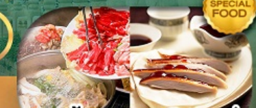
เมนู: สุกี้มองโก + เปิดปักกิ่ง เดินทาง เม.ษ. - ต.ค. 69