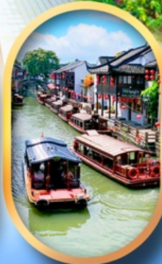
ถนนชานกิงเจีย