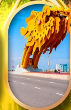
สะพานมังกรดาบิง